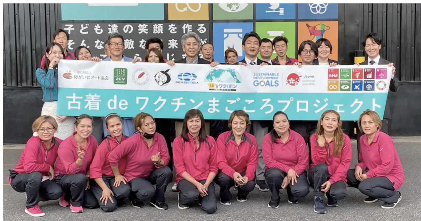
上記写真：古着 de ワクチン まごころプロジェクト発足式での集合写真